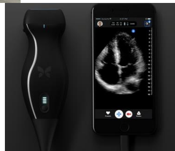
( Butterfly iQ)